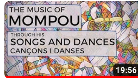
The music of Mompou through his "Songs &...